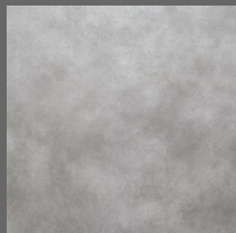
Stone - 101 Grey