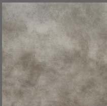
Stone - 103 Lunar