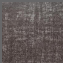
Grid - 306 Onyx