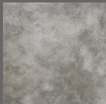
Stone - 102 Iron