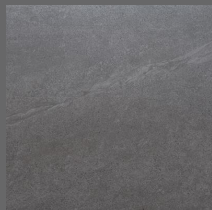
Marble - 204 Midnight