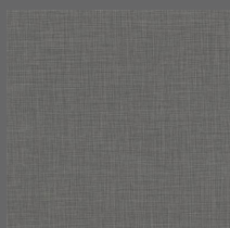
206 - Crossroads