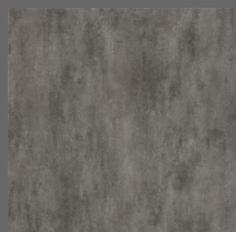
204 - Storm