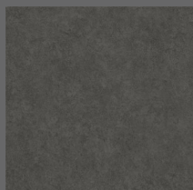
202 - Blackout