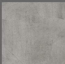
203 - Station