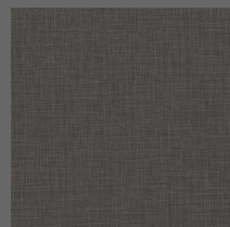
205 - Maps