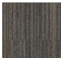
Connect - 102 - London