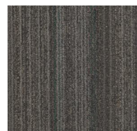
Connect - 105 - Dubai