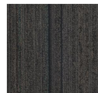
Connect - 106 - Berlin