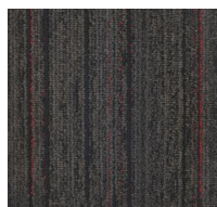
Connect - 103 - Paris