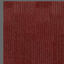
061 - Furnace