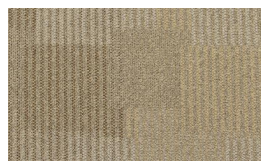
055 - Fancy