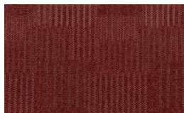
061 - Furnace