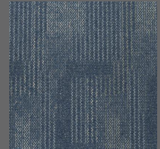
058 - Atlantis