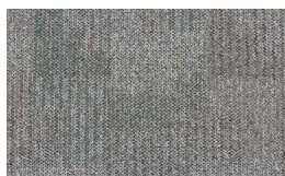
054 - Steel