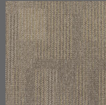
057 - Savanna