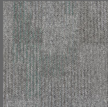
054 - Steel