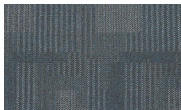
059 - Laguna