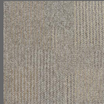
056 - Native