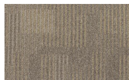
057 - Savana