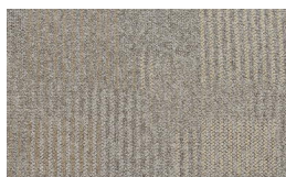
056 - Native