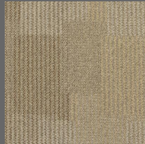
055 - Fancy