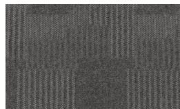
060 - Time