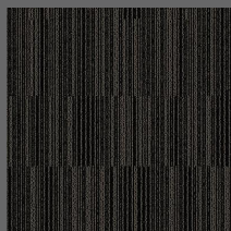
001 - Bege