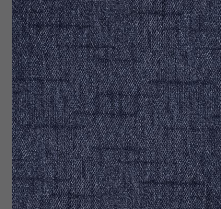
805 - River