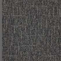
803 - Cromo