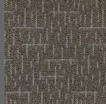
804 - Walker