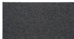
102 - Phantom