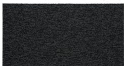
103 - Seal