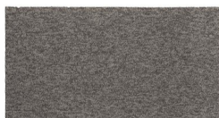
101 - Khaki