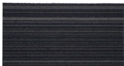
003 - Bréscia