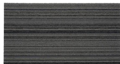
002 - Ferrara