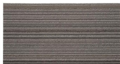
001 - Ravena