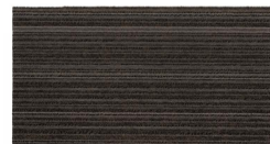
005 - Trento