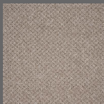
204 - Pergaminho