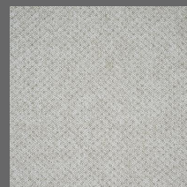
205 - Algodão