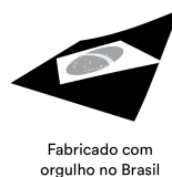
Fabricação no Brasil