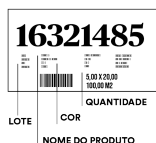
Inspeção - nome, cor, lote e quantidade