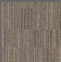
405 - Direct