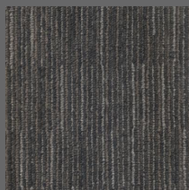
407 - Space