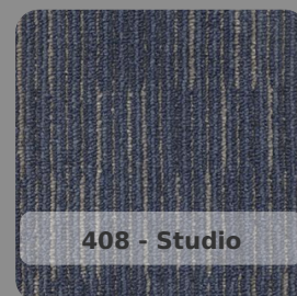
408 - Studio