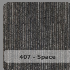
407 - Space