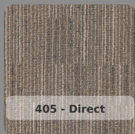
405 - Direct