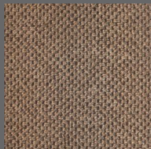
490 - Roraima