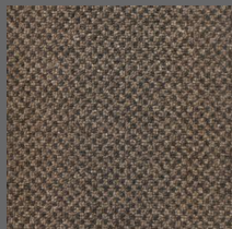
491 - Itajaí