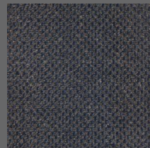
493 - Abrolhos