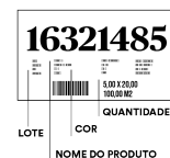
Inspeção - nome, cor, lote e quantidade