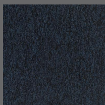
104 - Safira