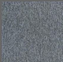
102 - Pérola