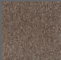
101 - Âmbar