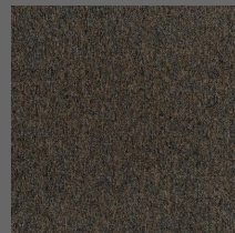
096 - Turmalina