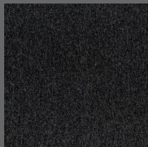
100 - Granito