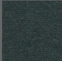
803 - Green