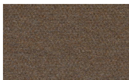
800 - Lever