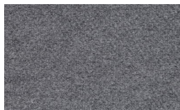
807 - Mist