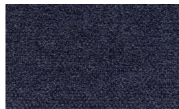
808 - Indigo