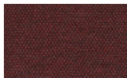
802 - Red