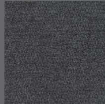
805 - Grey