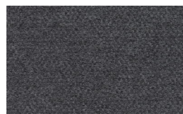
805 - Grey