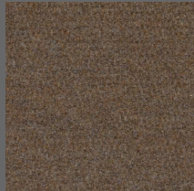
800 - Lever