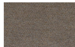
806 - Bege