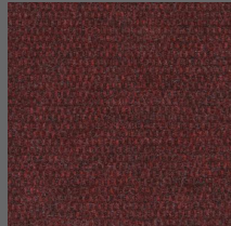
802 - Red