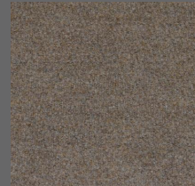
806 - Bege